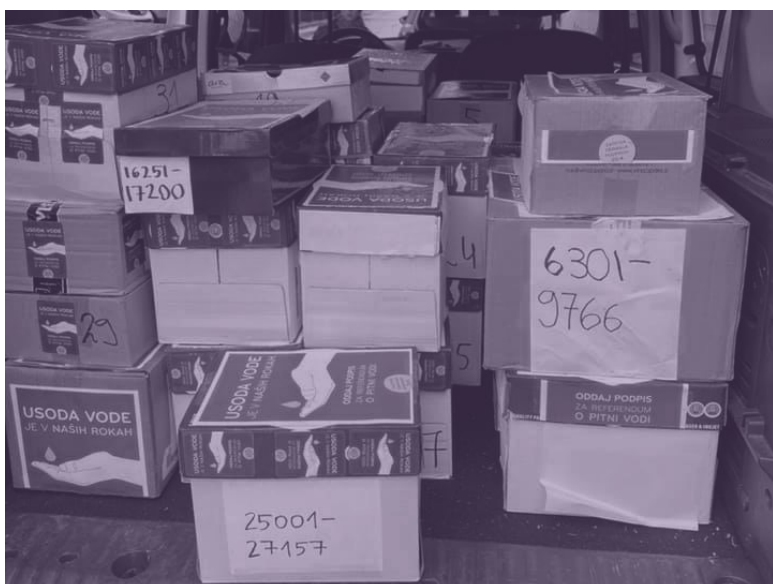
slika 4: škatle s podpisi

Postopek zahteva, da pri štetju podpisov s strani pristojnih organov prisostvujejo tudi pobudniki zakona, zato sta dve članici Inštituta dobršen del dneva preživeli v prostorih, kjer je potekalo uradno štetje podpisov. Ko so bili podpisi prešteti in evidentirani, se je naš boj šele dobro začel.