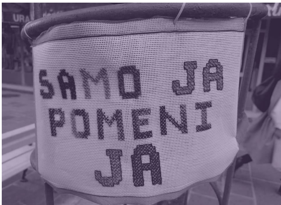
slika 3: transparent, ki je bil v času zbiranja podpisov nameščen pred AGRFT, avtor_ica izdel-

Zakon je šel na glasovanje na sejo državnega zbora 4. junija 2021. Poslanci so s 78 glasovi za in 3 proti potrdili novelo kazenskega zakonika, ki je vnesla nov koncept dojemanja spolnih kaznivih dejanj po modelu "samo ja pomeni ja".