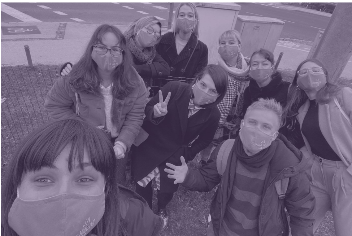
slika 5: Inštitut 8. marec, 17. februar 2021

Od 788.968 oddanih glasovnic jih je bilo veljavnih 787.072. Glasov ZA je bilo 13,25 odstotkov , oz. 104.312 volivcev oz. volivk, PROTI pa 86,75 odstotkov oz. 682.760 volivcev oz. volivk).