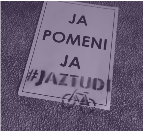
slika 1: transparent iz akcije Ja pomeni ja, 24. 7.

V Inštitutu 8. marec smo v letu 2020 pripravljali predlog zakona o spremembah in dopolnitvah kazenskega zakonika, ki smo ga poimenovali zakon “samo ja pomeni ja”, saj bi nova ureditev predpostavljala redefinicijo kaznivih dejanj posilstva in spolnega nasilja po afirmativnem modelu. Ideja za nov zakon je bila plod več akcij, ki smo jih izvedli, začevši z zbiranjem pričevanj zgodbe #jastudi o spolnih zlorabah in spolnem nadlegovanju v Sloveniji v letu 2018 in lansiranjem peticije za redefinicijo kaznivega dejanja posilstva in spolnega nasilja leta 2019. Zbrane zgodbe smo analizirali in jih predstavili na okroglih mizah, na katere smo bili povabljeni in povabljeni, ali na dogoskih, ki smo jih organizirali skupaj z branji prejetih pričevanj. Opozarjali smo na problematiko zlorabe pozicije moči ter ponovno viktimizacijo žrtve v okviru kazenskega postopka. V skladu z analizami v prostoru in po temeljitem pregledu obsoječega zakona je naša pravna služba na koncu leta 2020 oblikovala nov zakon, pri pisanju pa je izhajala iz zahtev zakonodaje o tem, kaj naj predlog zakona vsebuje.